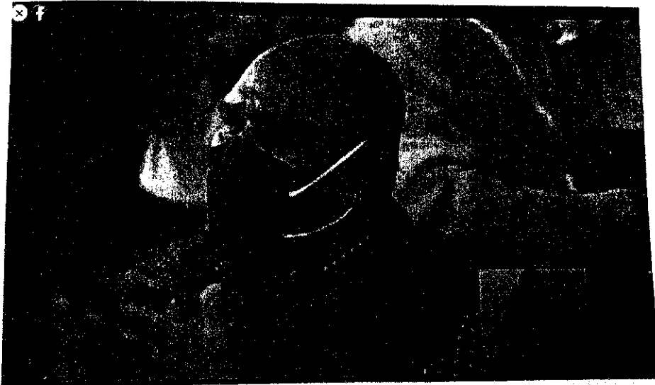
Imagen tomada del perfil público de la red social Facebook del C. Francisco Alfonso Durazo Montaña, del evento transmitido en vivo a través de dicha red social denominado "Arranque de Campaña San Luis Río Colorado" de fecha 14 de marzo de 2021, se puede advertir al hoy denunciado aplaudiendo al candidato [...], que el candidato mencionó que trabajarán en conjunto. (Minuto 40:13 del video)