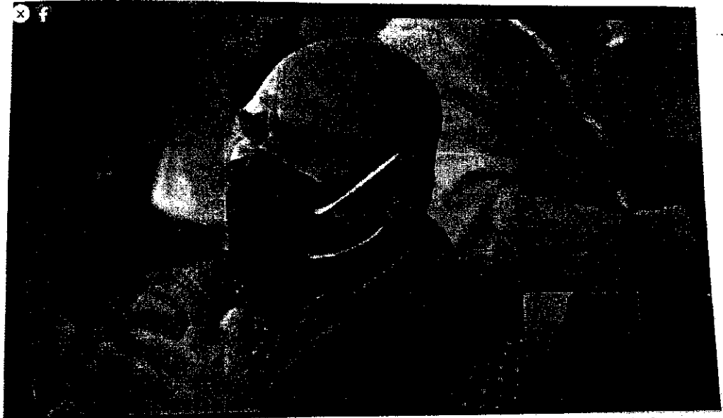
Imagen tomada del perfil público de la red social Facebook del C. Francisco Alfonso Durazo Montaña, del evento transmitido en vivo a través de dicha red social denominado "Arranque de Campaña San Luis Rio Colorado" de fecha 14 de marzo de 2021, se puede advertir al hoy denunciado aplaudiendo al candidato luego de que el candidato mencionó que trabajarán en conjunto. (Minuto 40:13 del video).

En el entendido de que, al momento de elaborar el acta de oficialía electoral que aquí se ordena, deberá describirse de manera detallada lo que resulte de la inspección del contenido de la imagen de mérito.