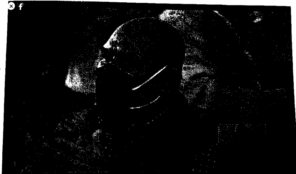
Imagen tomada del perfil público de la red social Facebook del C. Francisco Alfonso Durazo Montaño, del evento transmitido en vivo a través de dicha red social denominado "Arranque de Campaña San Luis Rio Colorado" de fecha 14 de junio de 2021, se puede advertir al hoy denunciado aplaudiendo al candidato a quien que el candidato mencionó que trabajarán en conjunto. (Minuto 40:13 del video)

EN EL ENTENDIDO DE QUE, AL MOMENTO DE ELABORAR EL ACTA DE OFICIALÍA ELECTORAL QUE AQUÍ SE ORDENA, DEBERÁ DESCRIBIRSE DE MANERA DETALLADA LO QUE RESULTE DE LA INSPECCIÓN DEL CONTENIDO DE LA IMAGEN DE MÉRITO.